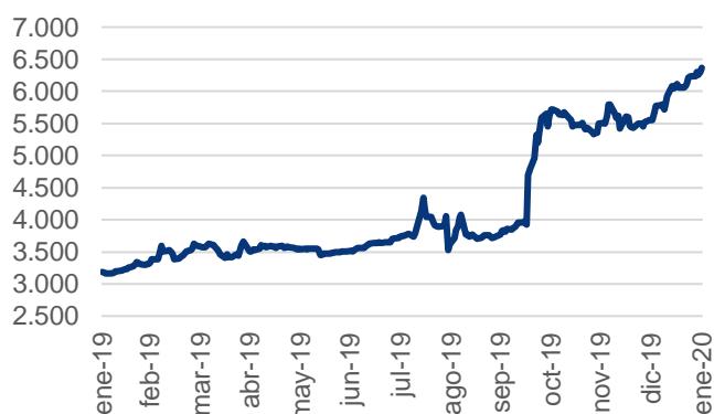
Evolución IAM Renta Crecimiento - Clase B

El fondo está dirigido a inversores con un nivel de riesgo medio cuyo objetivo sea poder acceder a una cartera diversificada de activos financieros de renta fija argentina dentro de un horizonte de mediano plazo.