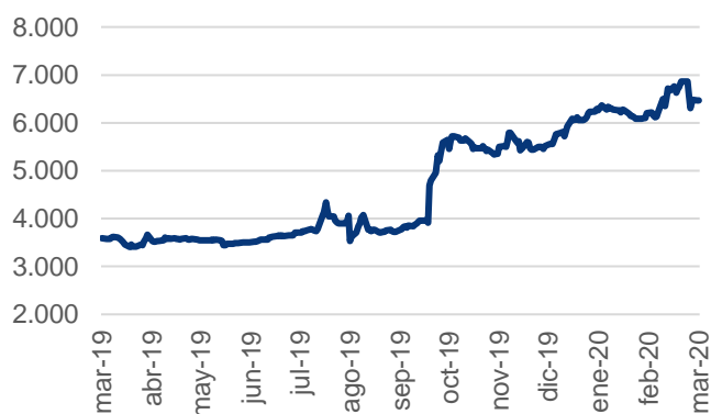
Evolución IAM Renta Crecimiento - Clase B

El fondo está dirigido a inversores con un nivel de riesgo medio cuyo objetivo sea poder acceder a una cartera diversificada de activos financieros de renta fija argentina dentro de un horizonte de mediano plazo.