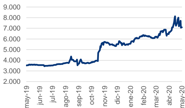
Evolución IAM Renta Crecimiento - Clase B

El fondo está dirigido a inversores con un nivel de riesgo medio cuyo objetivo sea poder acceder a una cartera diversificada de activos financieros de renta fija argentina dentro de un horizonte de mediano plazo.