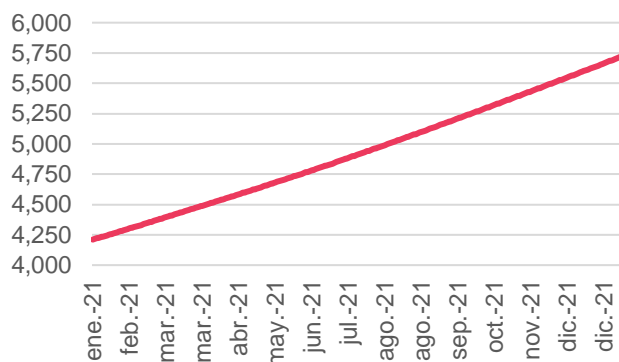
Rendimiento Anualizado expresado en TNA