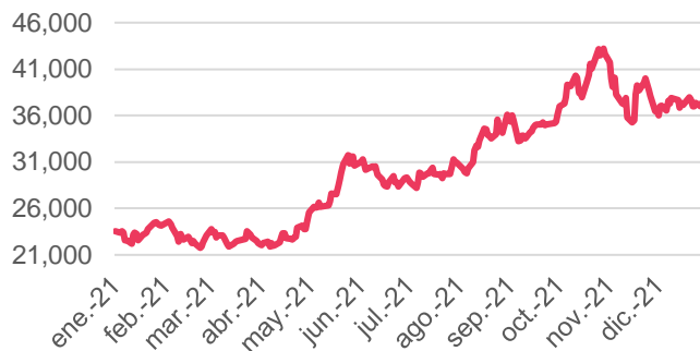
Rendimiento expresado en Tasas Directas