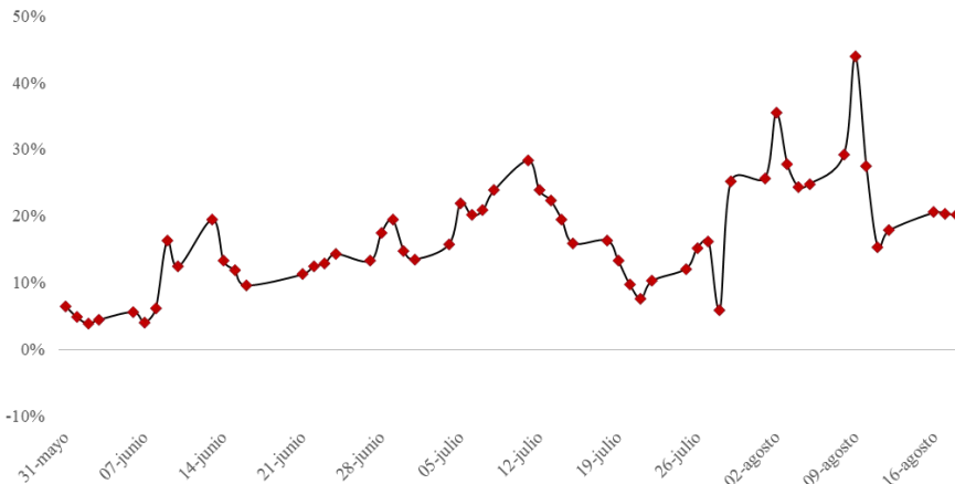
Sintético T2V2 vs Tasa Fija