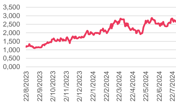
Evolución IAM Renta Mixta - Clase B

El fondo está dirigido a inversores con nivel de riesgo alto que buscan exposición a retornos de activos digitales, pudiendo soportar importante volatilidad de capital y crecimiento.